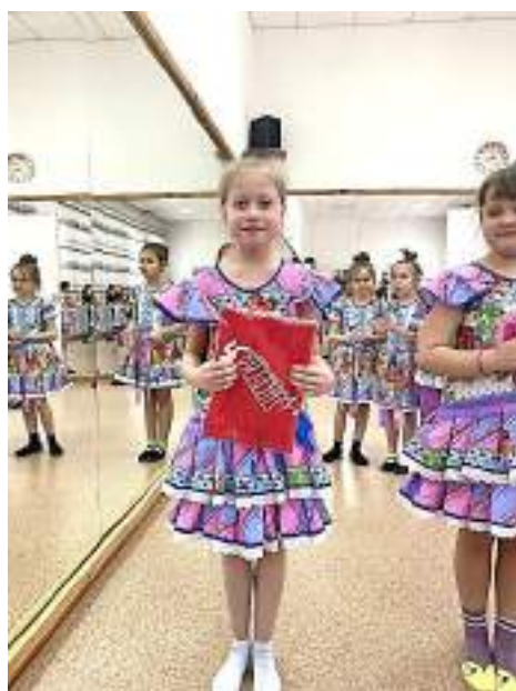
Фото с проекта